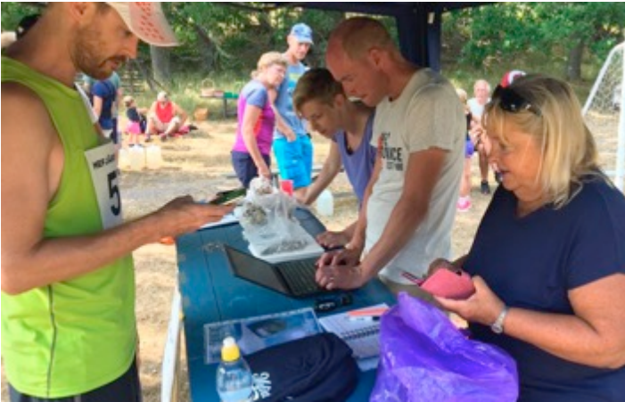
Mefjärdsmössan, försäljning vid Mefjärdsjoggen 16 juli 2018

18.900 kr är det i nuläget insamlade belopp på vår egen insamling hos WWF där vi stödjer deras arbete att rädda Östersjön.